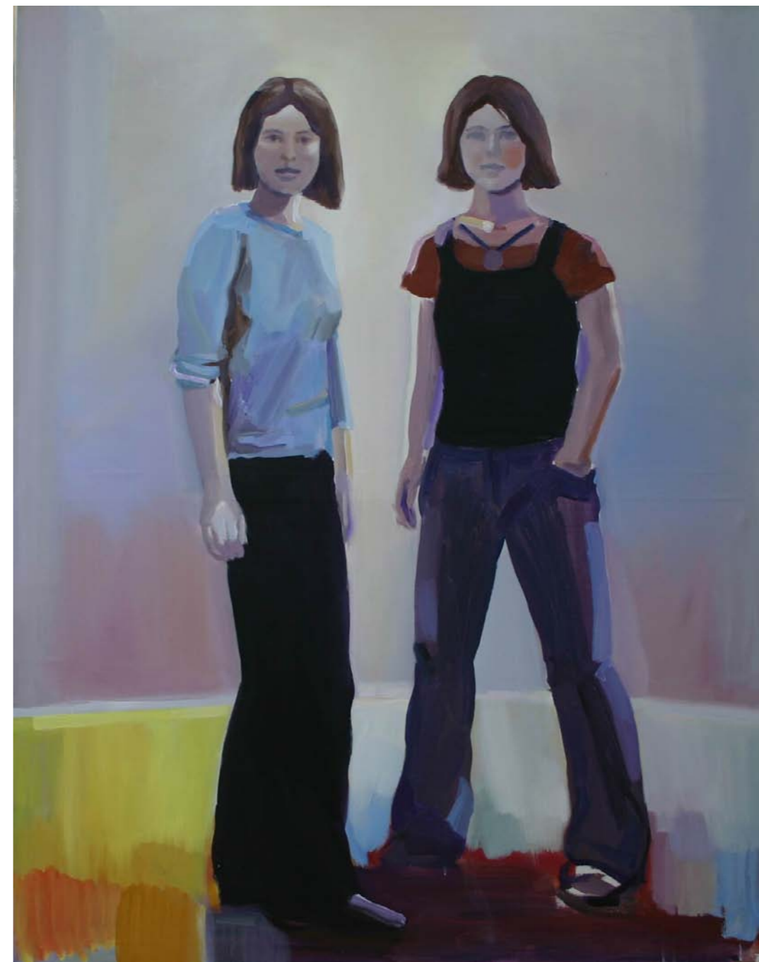
Pure Beauty, Setkání, 150 X 120 cm, akryl / plátno, 2006

Pure Beauty: "Jen jsem uviděla zastávku v Dehtářích, napadlo mi na její čelní stěnu namalovat dvojici dívek, kterou jsem už jednou ztvárnila na plátně. Říkala jsem si, jak by takový lidský prvek celé místo oživil. Rozhodla jsem se namalovat tento motiv v tajnosti přes noc, aby se na místě najednou objevil a to kouzlo jemné poezie, které jsem měla na mysli, tím ještě získalo na překvapivosti. Nebála jsem se do toho vložit vlastní úsilí, čas i peníze."