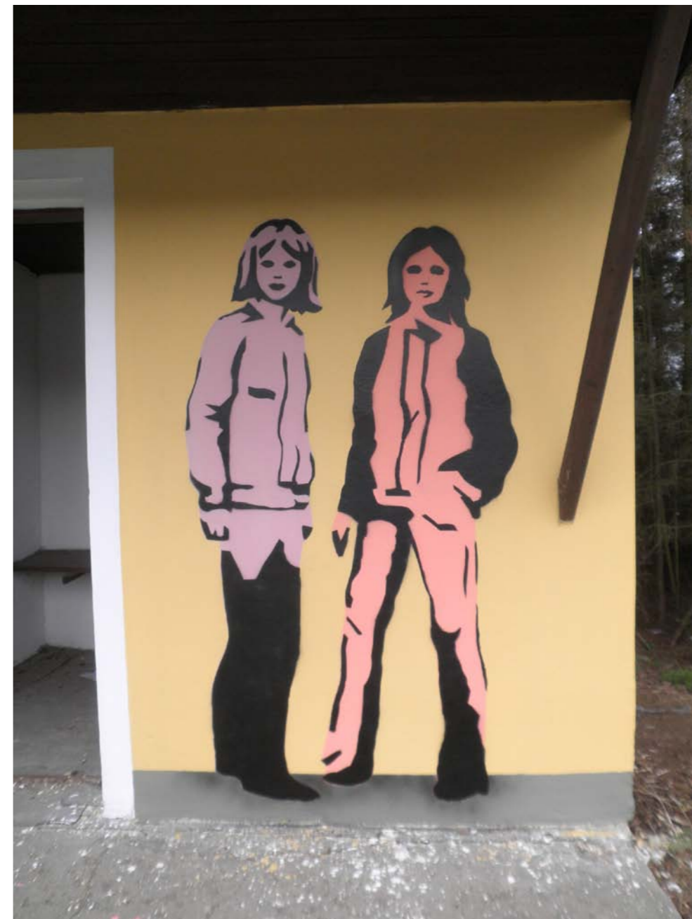
Legální verze figurální výmalby - motiv dvou dívek. Z boků následují motivy: motiv holčičky - školačky a motiv psa.